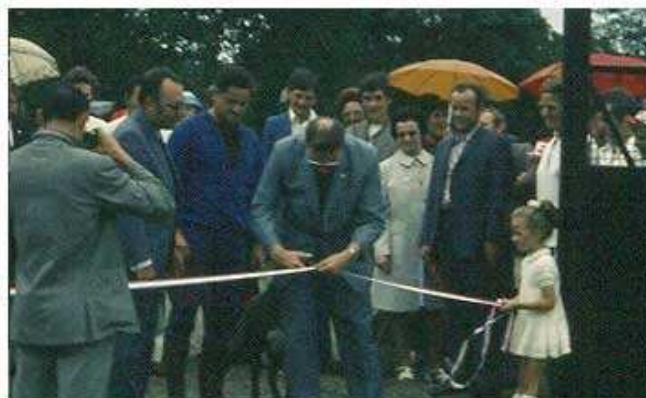
Inauguration du club-house