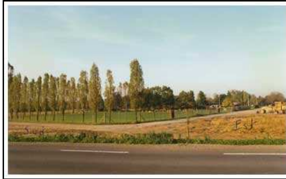
Terrain de 1976 à 1995

En 1978 l'éclairage sur le terrain est installé pour les entraînements et concours nocturnes.