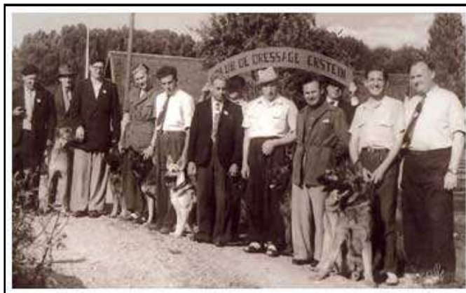
De gauche vers la droite :

Ce club a malheureusement dû s'arrêter d'exercer par manque de chiens en 1962. Tout au long de son existence des résultats très honorables sont obtenus.