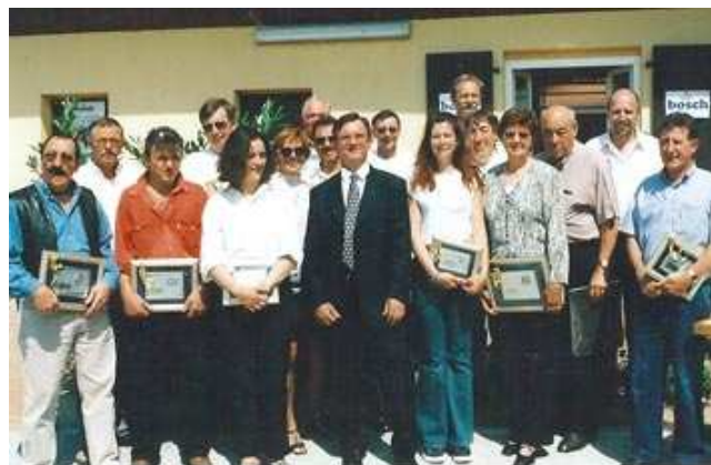
Les membres de 20 - 25 et 30 années de présence au club