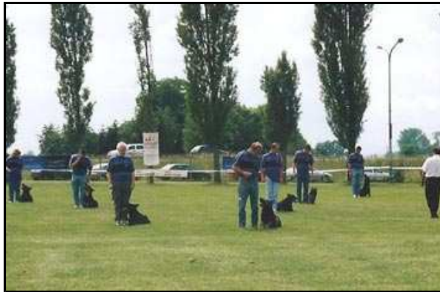
DEMONSTRATION DES MEMBRES DU CLUB