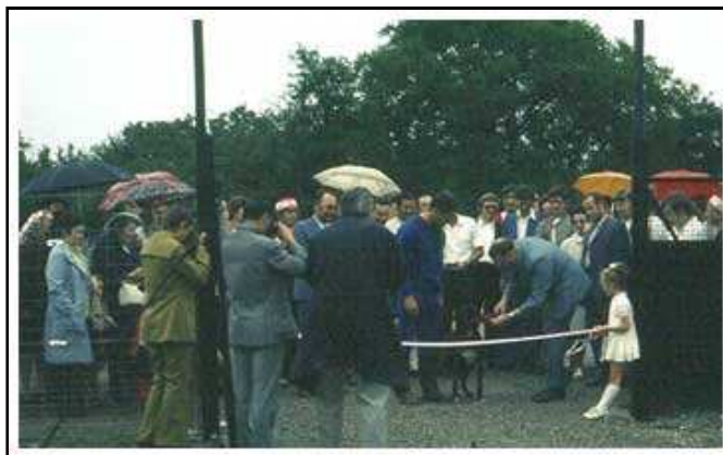
Inauguration du club-house